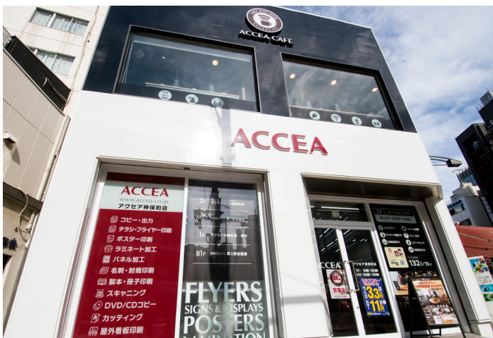
アクセアの店舗 (神保町店)