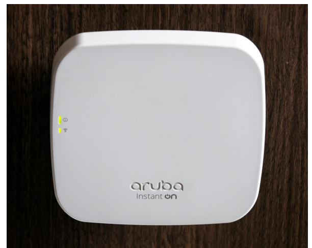
店舗内に設置されているAruba Instant On AP11