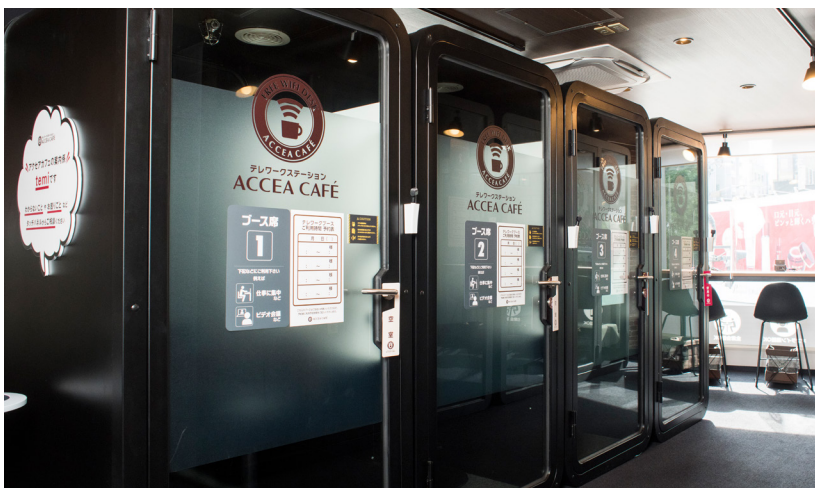
Web会議に便利な個室ブース

アクセアでは、店舗のさまざまな箇所でスマート化が進められている。例えばフィットネススタジオ「ACFit-アクフィット」の一部店舗で提供しているセルフフィットネスサービスには、Wi-Fi 接続のマシンを採用。アクフィットやアクセアカフェの一部店舗では、独自開発のロボットによる巡回も行われる。またデジタルプリント事業でも、利用者が仕上がり品を都合の良い時間に受け取れるようスマートロッカーの設置が進められている。24 時間営業の店舗のなかには、夜間にスタッフが常駐しない無人営業を行っているところもあり、ここでは店舗入口にスマートロックを設置、アプリによる認証